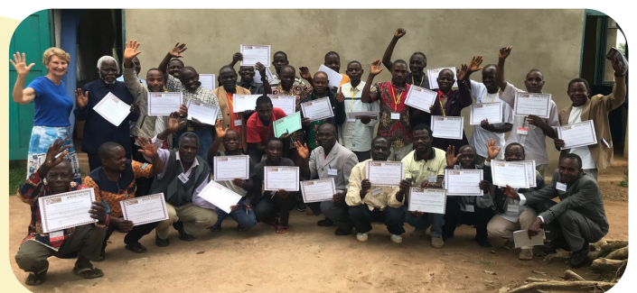
Pygmeë evangelisten aan einde van de training

(De tekst gaat op de achterzijde verder)